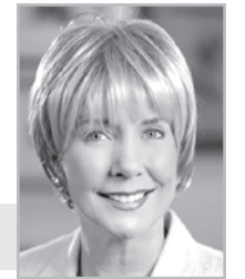
Джонни Эрексон Тада

«А Тому, Кто действующею в нас силою может сделать несравненно больше всего, чего мы просим, или о чем помышляем, Тому слава в Церкви во Христе Иисусе во все роды, от века до века. Аминь» (Ефессянам 3:20,21).