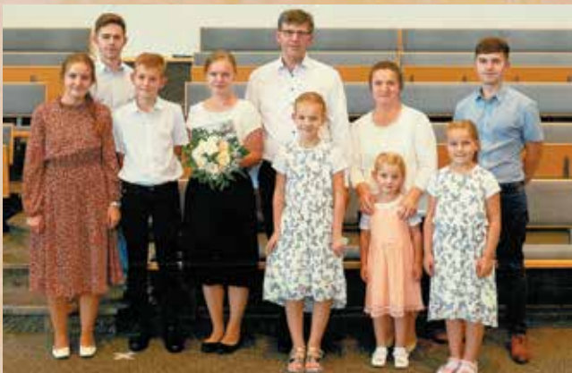
Семья Андерс, Германия