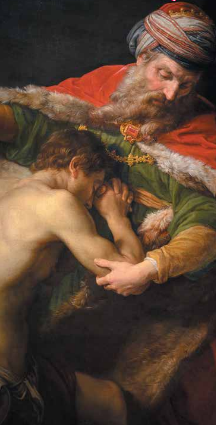
Помпео Джироламо Батони. Возвращение блудного сына. 1773.